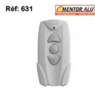
Télécommande portable Francliaflex