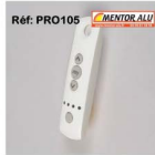
Télécommande Tellis 4 Profalux