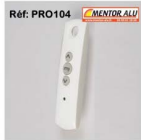
Télécommande Tellis 1 Profalux