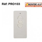
Télécommande portable Profalux