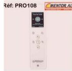
Télécommande Zoé Profalux