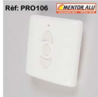
Télécommande murale Profalux

Vous pouvez commander vos télécommandes directement sur notre site e boutique : www.mentor-alu.fr rubrique pièces détachées