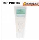
Télécommande Noé Profalux